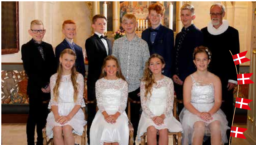
Strandby Kirke d. 28. april

Vi ønsker her fra menighedsrådet og sognepræsten i Louns, Alstrup og Strandby Pastorat et stort tillykke til årets konfirmander, der blev konfirmeret i Strandby og Louns kirke.